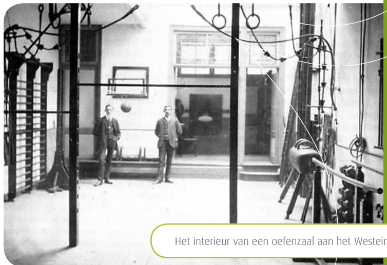
Het interieur van een oefenzaal aan het Westeinde 29

teamverband behoorlijk zelfstandig voor een opdrachtgever aan complexe opdrachten op het gebied van sportstimulering en evenementen organisatie. Soms zijn de sportstimuleringsopdrachten wijkgericht, maar steeds meer ondersteunen we de georganiseerde sport. Aan dit project zijn onderzoeksopdrachten gekoppeld die door Halo-docenten in het kader van hun masteropleiding uitgevoerd worden.