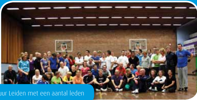
Bestuur Leiden met een aantal leden

creatief) en de blik naar buiten richten (breedte en toekomst) is een noodzakelijk goed.