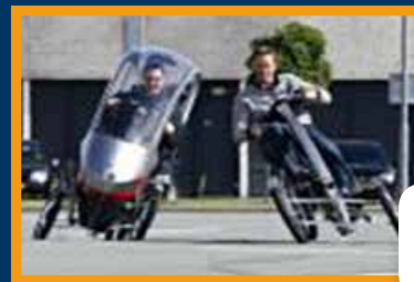
Fiets van de toekomst?