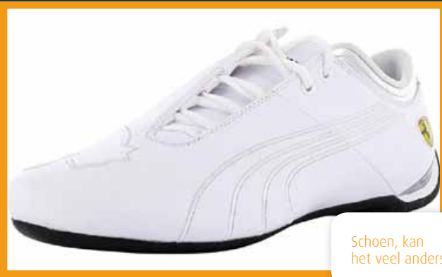
Schoen, kan het veel anders