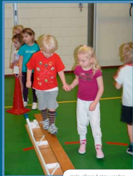
Help elkaar beter worden.

Verder is gevraagd waar leerkrachten behoefte aan hebben bij een methode bewegingsonderwijs voor kleuters: