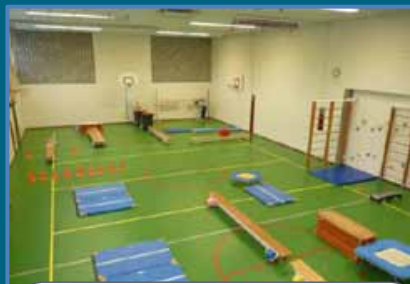
Een zaaloverzicht van één van de lessen uit Gymmen in de grote gymzaal .