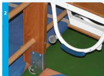
De wieltes van de bank altijd aan de hoge kant.