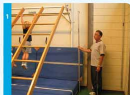
Het klimraam op deze foto is op iedere gewenste hoogte vast te zetten. Voor leerlingen van groep 1 en 2 wordt een maximale hoogte van 2,5 meter geadviseerd in verband met hun belastbaarheid.