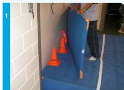
Zet pylonen achter de tummat, zodat deze minder snel omvalt.