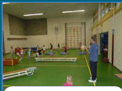
Dit meisje is vandaag voor het eerst en kijkt nog even mee.