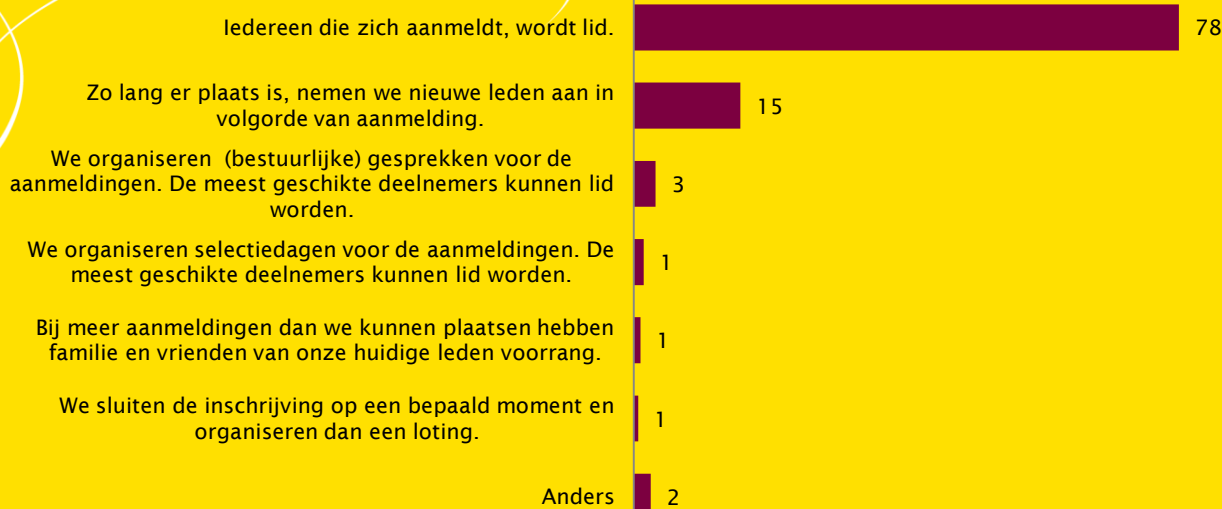
Figuur 3. Omgang met aanmeldingen (% verenigingen, n=874)

Het MI-Verenigingspanel bestaat uit sportverenigingen die periodiek bevraagd worden op allerlei aspecten van het verenigingsbeleid. Door de samenstelling van het panel en weging van de respons zijn de uitkomsten representatief voor de sportverenigingen in Nederland.