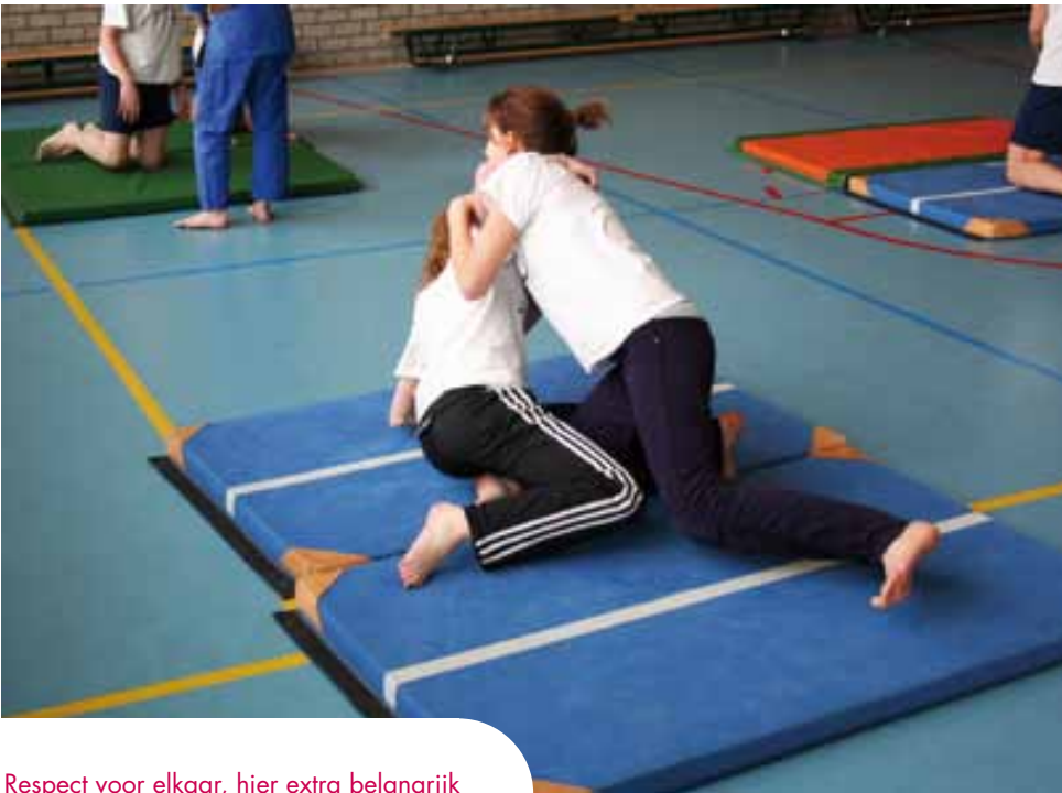
Respect voor elkaar, hier extra belangrijk

mogelijkheden te geven om in het onderwijs te slagen, moeten leerkrachten zich niet alleen bewust zijn van wat kinderen moeten leren, maar ook van de kennis en vaardigheden die de kinderen meenemen van hun taalkundige en culturele achtergrond. (Cummins, 1986; Fillmore & Snow, 2002; Genesee, 1994; Moll, Amanti, Neff, & Gonzalez, 1992). (Park & King, 2003, p.1)