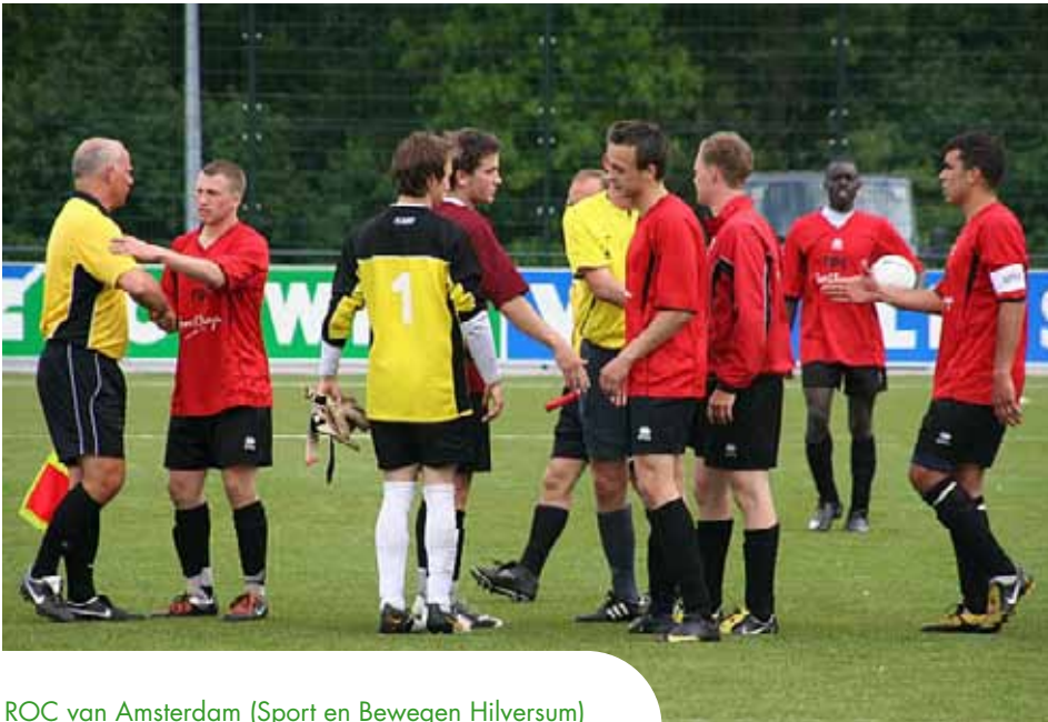
ROC van Amsterdam (Sport en Bewegen Hilversum)

hierbij hun verenigingen. Dat kan gaan van het beschikbaar stellen van aflopende financiële middelen (bijvoorbeeld Nederlands Handbal Verbond en Nederlandse Volleybal Bond) tot het leveren van materiaal- en lespakketten voor de verenigingen om onderwijsgroepen te kunnen ontvangen (bijvoorbeeld Squash Bond Nederland en Koninklijke Nederlandse Hockey Bond). Ook voor het mbo biedt dit mogelijk nieuwe (ondersteunings)mogelijkheden. Om daar gebruik van te maken, kunnen verenigingen en mbo-scholen zich aanmelden ( www.nocnsf.nl/sportenonderwijs ).