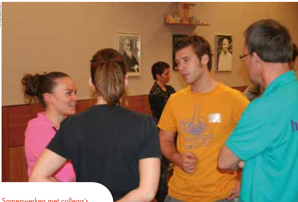
Samenwerken met collega's