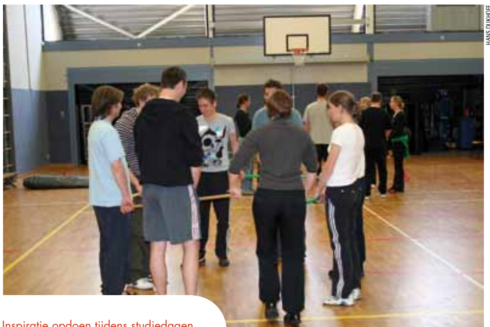
Inspiratie opdoen tijdens studiedagen

Een nieuwe ontwikkeling in het beroepenveld is de toenemende samenwerking van vakverenigingen van verschillende vakken onderling en de ondersteuning van de SBL aan de beroepsgroep voor leraren. De SBL ontwikkelde in opdracht van de overheid met werkgroepen van leraren bekwaamheidseisen die opgenomen zijn in de Wet BIO (Beroepen in het onderwijs) in het Besluit Bekwaamheidseisen Onderwijspersoneel (OCW, 2005b). Deze werden geformuleerd in zeven competenties die als beroepsstandaarden moeten gaan functioneren. Bovendien zijn de vakverenigingen