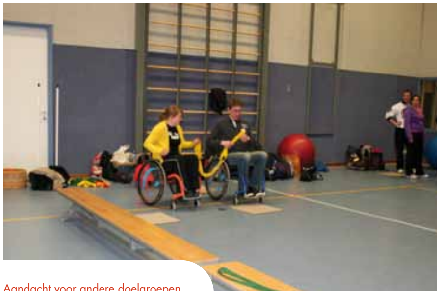
Aandacht voor andere doelgroepen

Algemene taken voor het onderwijs zijn: het bevorderen van ontplooiing van een breed scala van kwaliteiten bij leerlingen en hen toerusten voor leven en werken in een multiculturele samenleving.