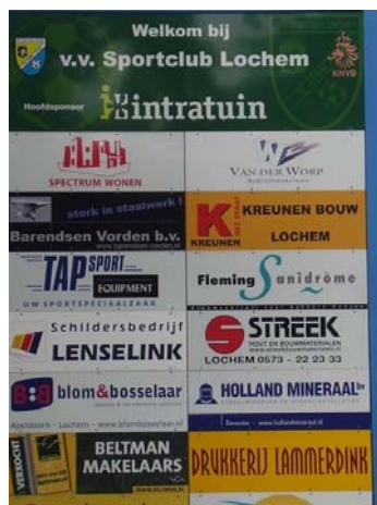
Eigen inkomsten, hier van V.V. Lochem

Grote, maar ook kleine sportverenigingen zijn steeds meer bedrijven, professioneel gerund door vrijwilligers en met vrijwilligers. De verenigingen investeren ook veel uit eigen middelen en verwerven daar de bijbehorende inkomsten voor. Veel verenigingen hoeven geen beroep te doen op de gemeente Lochem. Landelijk gezien kan geconstateerd worden dat investeren in innovaties zonder hulp van de gemeente erg moeilijk is.