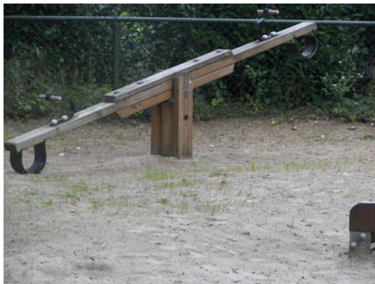
Waar blijven de kinderen .....

Een mogelijke verklaring is het geringe kindertal in sommige 'voedingsgebieden' (zie ook bijlage 3).