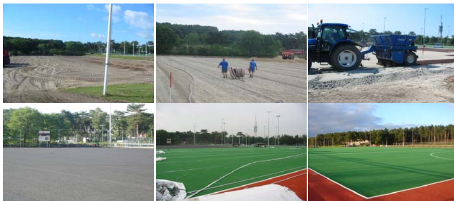
Aanleg van een kunstgrasveld

Tot slot: voetbal zou geen echt voetbal meer zijn als het op kunstgras gespeeld wordt. Het antwoord is aan de voetbalverenigingen. Zij willen allemaal 19 kunstgras (en willen ook allemaal dat de gemeente Lochem dit betaalt).