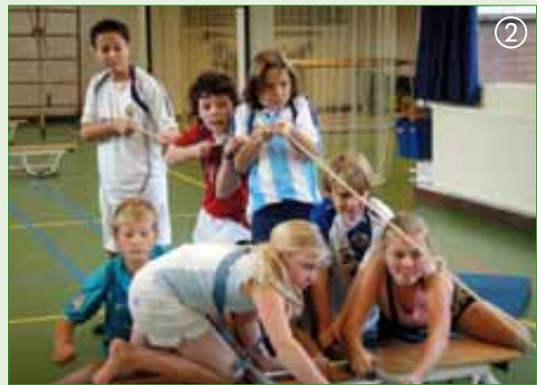
Over het tweede ravijn

Vanaf dit moment wordt iemand ziek. Het matje wordt op de ladder gelegd, de zieke erop en de kinderen gaan enthousiast de mat over de ladder schuiven. Hierbij hebben ze niet in de gaten, dat de ladder ook gaat verschuiven en met een luide klap in het ravijn terecht komt. Opnieuw beginnen! Wat is de oplossing? Eerst moet er iemand naar de overkant om het touw los te maken. Dat zit toch maar in de weg. Dan houdt die persoon al knielende de ladder tegen, terwijl een kind op de ladder de mat gaat trekken en de anderen de mat gaan schuiven. Is de mat aan het eind van de ladder gekomen, dan mag de zieke er af. De kinderen weten maar al te goed dat ze er bijna zijn en stuiven over de ladder. Wijs ze er op dat ze rustig moeten blijven, want een fout is zo gemaakt. De ladder meenemen is voor velen een fluitje van een cent. Het touwtje vastmaken aan de ladder en deze net een ophaalbrug omhoog trekken. Als dit gelukt is, is de klus geklaard! De groep heeft een punt gehaald en mag proberen een tweede punt te halen.