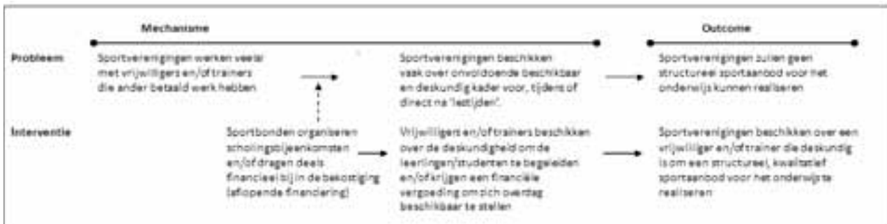
Schema 2 over deskundigheidsbevordering (onderdeel B)