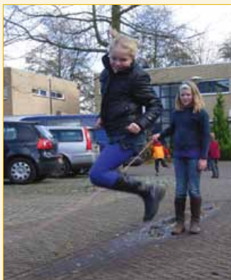
Foto 12: Trucs