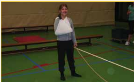
Geblesseerde leerling als draaier