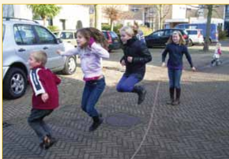
Foto 11: Veel leerlingen