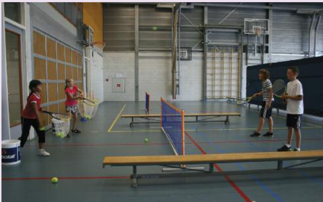
Slaan en vangen in visnet

Rond de wereld: speel de bal over het net in het veld. Nadat je geslagen hebt, loop je langs het net naar de andere kant en sluit achter aan. Sla je de bal verkeerd of kan je de bal niet meer goed terugspelen, dan ben je af. De twee laatst overgebleven spelers spelen een finale tot de drie punten.