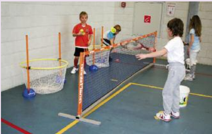
Mikken in de richthoepel

verrassende van leerlingen bleek weer eens! Naar aanleiding van deze ervaringen zijn de activiteiten op loopt 't-, lukt 't- en leeft 't-aspecten aangepast. Dit proces heeft zich meerdere malen herhaald en pas na tien keer waren we tevreden over het product. Nadat het product voor vijf- tot achtjarigen was voltooid zijn we aan de slag gegaan om ook voor de groep negen- tot twaalfjarigen activiteiten op maat te maken. De werkwijze is hierin soortgelijk geweest, met dien verstande dat de niveauverschillen bij deze leeftijdsgroep nóg groter kunnen zijn zodat we meer uitbouw mogelijkheden moeten bieden.