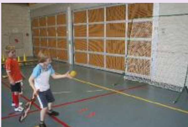
Slaan tegen trainingswand

alle leerlingen in principe hieraan deel kunnen nemen (oproepbaarheid).