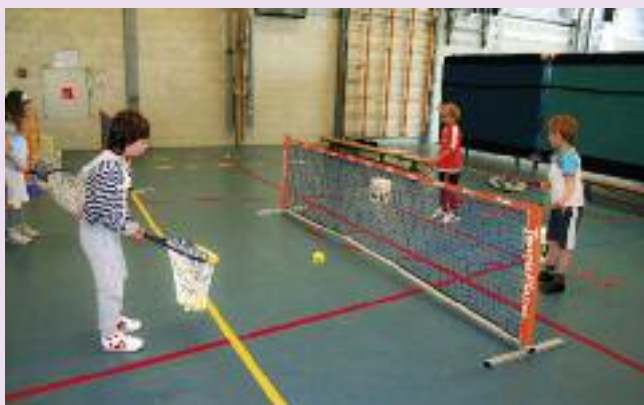
Slaan en vangen in visnet

Slaan en vangen in visnet: speel de bal met je racket over het net. De ander probeert de bal te vangen in het visnet.