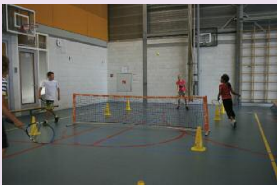
Rond de wereld

Correspondentie: tj.vandenberg@tennisevents.nl of ir.dokman@windesheim.nl