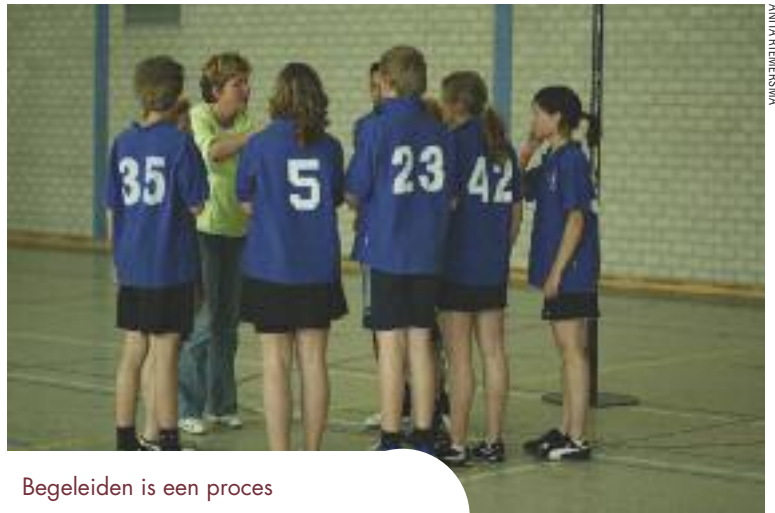
Begeleiden is een proces

Nieuwe initiatieven zijn nodig. De maatschappelijke stage laat jongeren ontdekken hoe leuk het is om iets voor anderen en met anderen te doen. Bijvoorbeeld door de F-jes te trainen, een wijkfeest te organiseren of een website te maken voor een vrijwilligersorganisatie. Ze kunnen hun stage op verschillende manieren invullen. Het leert hen zich verantwoordelijk te voelen voor anderen, de buurt,