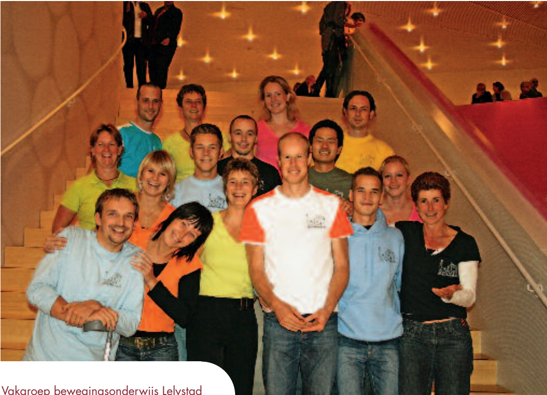
Vakgroep bewegingsonderwijs Lelystad