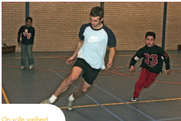
Op volle snelheid