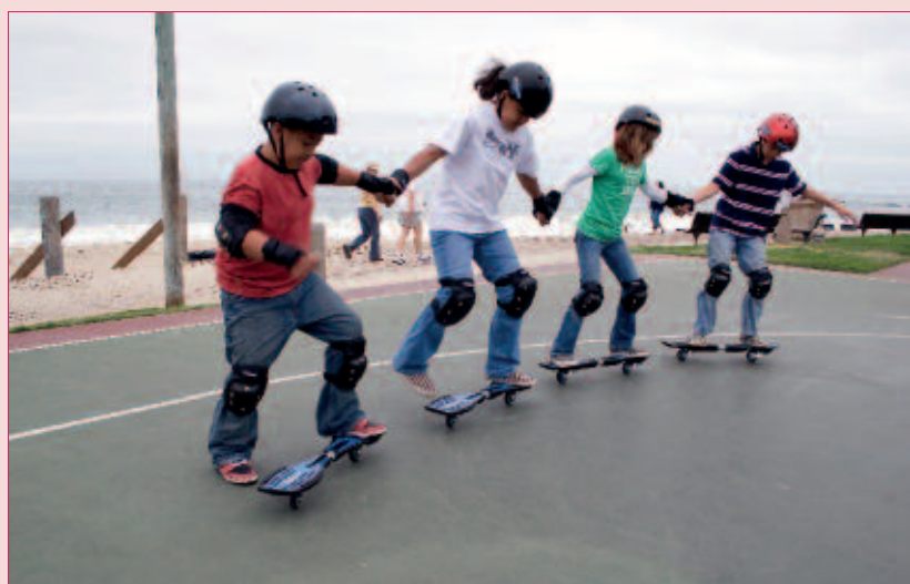
Kids in rijtje

het streetsurfen trainen leerlingen tevens hun boven- en onderbenen, het concentratievermogen en wordt hun doorzettingsvermogen vergroot. Daarnaast zal de coördinatie en het evenwichtsgevoel verbeteren én ze zullen samen in teamverband spelen en actief bezig zijn. Het uiteindelijke doel van deze clinics is om leerlingen te enthousiasmeren en plezier te laten