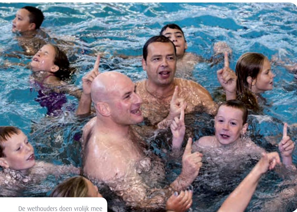
De wethouders doen vrolijk mee