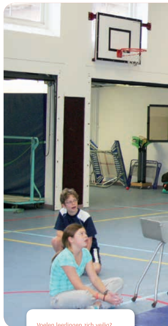
Voelen leerlingen zich veilig?