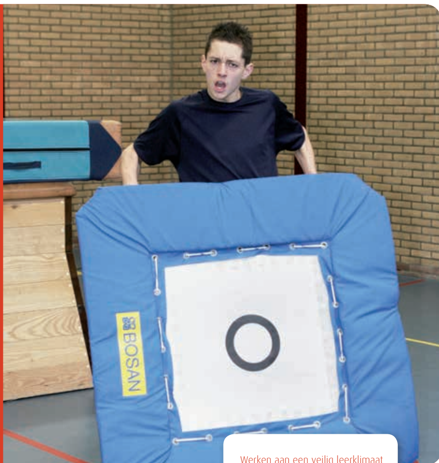
Werken aan een veilig leerklimaat

Door: Annematt Collot d'Escury, Jarno Hilhorst, Roel van Beusekom en Ivo Dokman