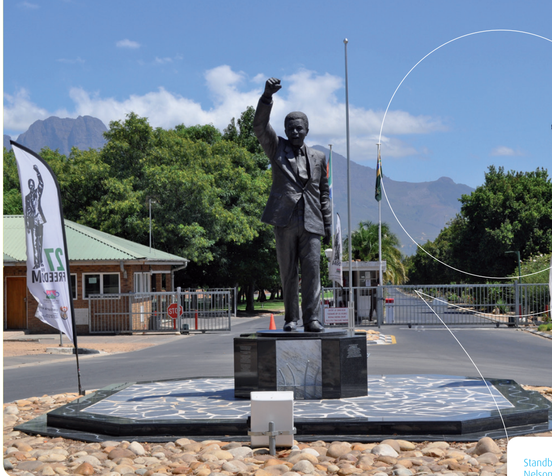
Standbeeld Nelson Mandela

een goed zwaargewichtbokser was. De laatste twee jaar van zijn straf, heeft hij in Drakenstein uitgezeten en heeft de sport tijdens zijn gevangenisstraf ingezet om frustratie kwijt te raken. Drakenstein heette toentertijd nog Victor Verster.