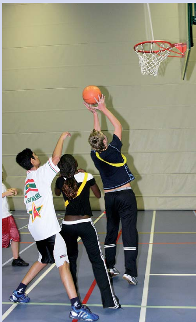
Onder druk scoren van dichtbij