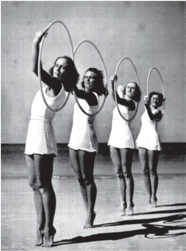
Britney Spears, Madonna, Shakira en Christina Aguilera?

leefwereld en de persoonlijke ontplooiing. Ook niet wanneer we over het bewegingsonderwijs spreken.