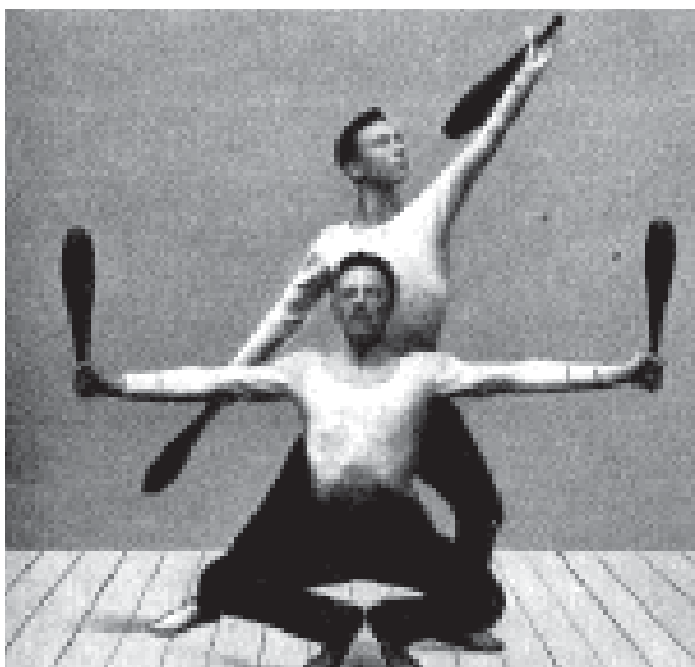
Zover hoeven we niet terug...

Het gevoel van ongenoegen is waarschijnlijk terug te voeren op het 'misbruiken' van de drie hoofddoelen van het onderwijs: persoonlijke ontplooiing, maatschappelijke voorbereiding en beroepsvoorbereiding. Wat er in bovenstaande redenering rondom CKV gebeurt (en op dit moment ook met bewegingsonderwijs), is dat een vak dat in eerste instantie als 'algemeen-vormend-vak' is opgenomen in het curriculum van een school en daarmee voornamelijk gericht is op de persoon-