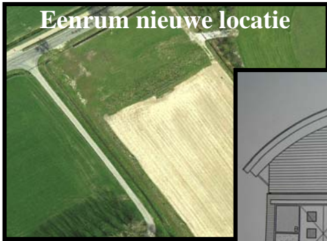
Eenrum nieuwe locatie