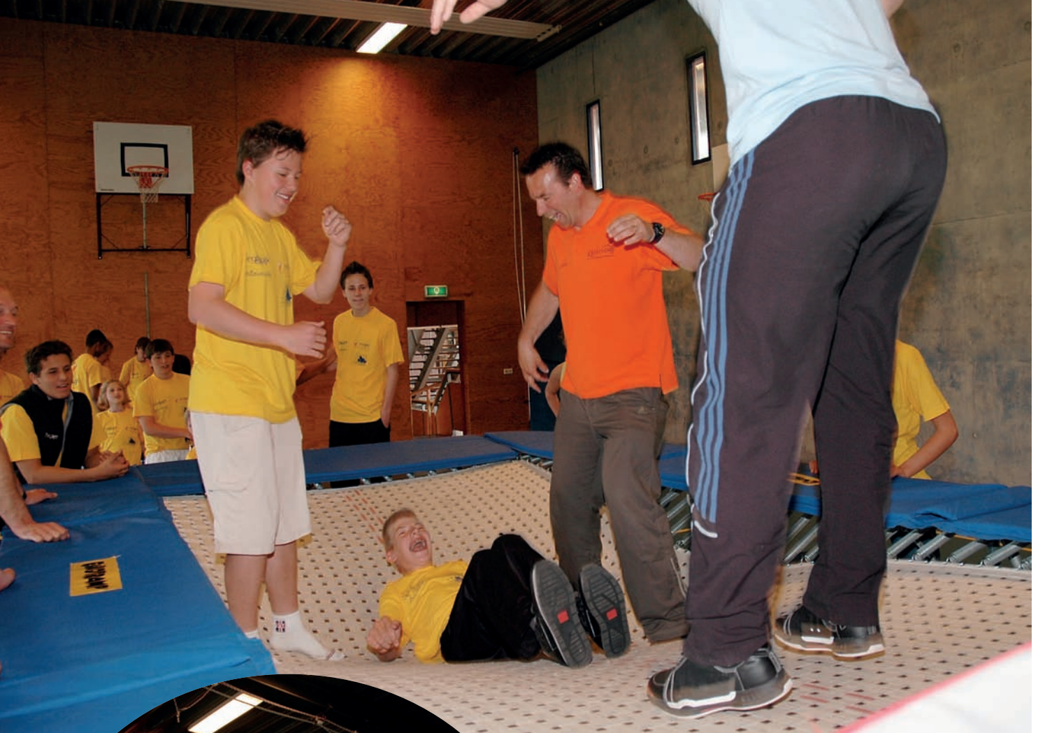
Het plezier straalt ervan af