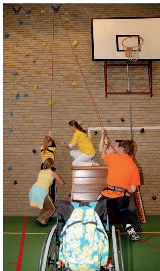
Het is hard werken

konden lopen, of ze wel eens uit hun rolstoel kwamen en wat hun lichamelijke beperking was. Een heel leerzame opdracht, vonden de groepsleerkrachten van de MMS, omdat de kinderen op deze manier leren vertellen wat hun beperking is. Na het invullen van de kennismakingsbriefjes waren wij aan de beurt. De docenten LO konden nu de kinderen van de MMS koppelen aan onze LO2-leerlingen. De opmerkingen van de vakdocenten van de MMS, die later op hetzelfde formulier vermeld werden, waren daarbij van grote waarde. Ze gaven op deze formulieren tips zoals: 'gesloten vragen stellen, niet optillen onder de armen, niet-sprekend kind, enz'. Daarnaast gaven ze een korte omschrijving van het eventuele ziektebeeld, zodat de leerlingen van het Segbroek College die later weer konden opzoeken op het internet. Zo moesten ze zich dus wat meer verdiepen in de beperking van hun 'Buddy'. Na het koppelen van onze leerlingen aan de kinderen van de MMS kregen onze leerlingen de kennismakingsformulieren onder ogen. Nu moesten wij op onze beurt een leuke brief terugsturen. Ze konden de hobby's natuurlijk gebruiken als gespreksstof en vertelden wat over hun eigen hobby's. Na deze brieven was de volgende stap een bezoek aan de gymles op de MMS. We splitsen onze groep in tweeën zodat ons bezoek hun gymles niet teveel zou ontregelen. Het was erg leerzaam en we stonden versteld hoe snel onze leerlingen initiatief namen om te helpen in de gymles. We mochten