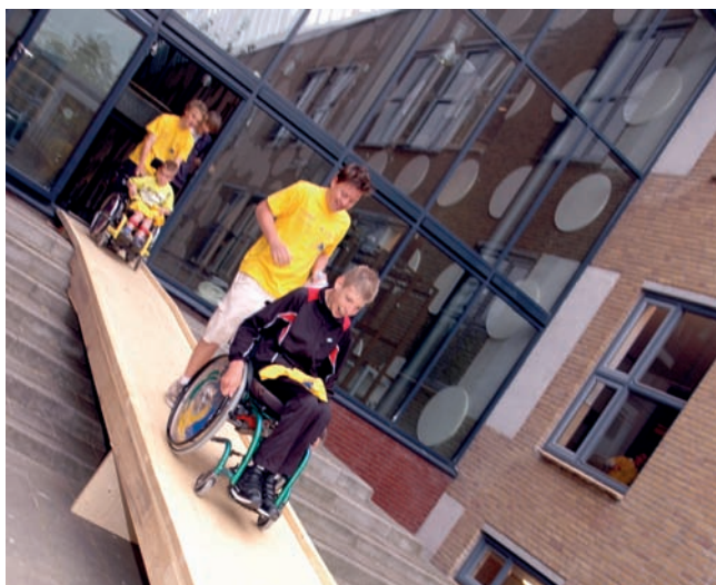
Eén op één