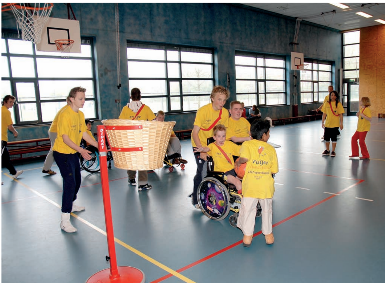
Samen in de zaal

konden lopen, of ze wel eens uit hun rolstoel kwamen en wat hun lichamelijke beperking was. Een heel leerzame opdracht, vonden de groepsleerkrachten van de MMS, omdat de kinderen op deze manier leren vertellen wat hun beperking is. Na het invullen van de kennismakingsbriefjes waren wij aan de beurt. De docenten LO konden nu de kinderen van de MMS koppelen aan onze LO2-leerlingen. De opmerkingen van de vakdocenten van de MMS, die later op hetzelfde formulier vermeld werden, waren daarbij van grote waarde. Ze gaven op deze formulieren tips zoals: 'gesloten vragen stellen, niet optillen onder de armen, niet-sprekend kind, enz'. Daarnaast gaven ze een korte omschrijving van het eventuele ziektebeeld, zodat de leerlingen van het Segbroek College die later weer konden opzoeken op het internet. Zo moesten ze zich dus wat meer verdiepen in de beperking van hun 'Buddy'. Na het koppelen van onze leerlingen aan de kinderen van de MMS kregen onze leerlingen de kennismakingsformulieren onder ogen. Nu moesten wij op onze beurt een leuke brief terugsturen. Ze konden de hobby's natuurlijk gebruiken als gespreksstof en vertelden wat over hun eigen hobby's. Na deze brieven was de volgende stap een bezoek aan de gymles op de MMS. We splitsen onze groep in tweeën zodat ons bezoek hun gymles niet teveel zou ontregelen. Het was erg leerzaam en we stonden versteld hoe snel onze leerlingen initiatief namen om te helpen in de gymles. We mochten