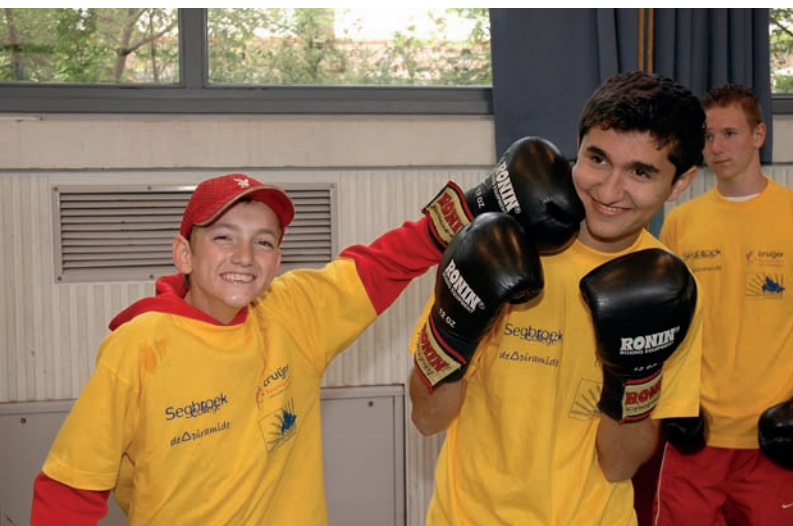
Ik kan 'm hebben

We wilden onze leerlingen niet onvoorbereid aan deze sportdag laten beginnen. Daarom organiseren we een kennismaking. De kinderen van de MMS kregen van hun vakleerkracht een kennismakingsbrief met korte vragen. Het was de bedoeling dat de kinderen die zelf invulden, voor zover mogelijk. Er werd gevraagd naar hun hobby's, of ze in een rolstoel zaten of