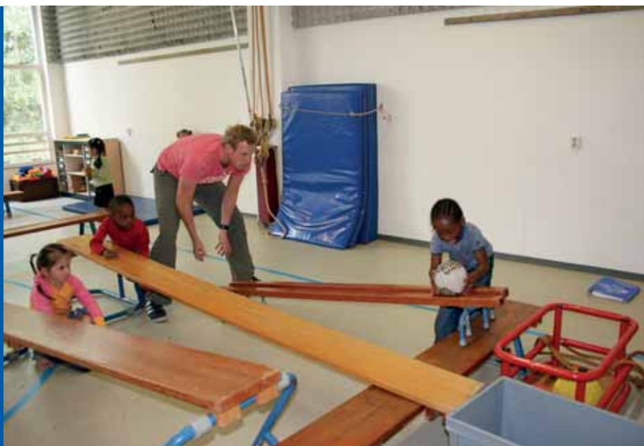
Rollen met de bal

De kunst is om al die energie die de kinderen meebrengen te kanaliseren. Wanneer dat lukt stijgt de les naar ongekende hoogte met springende, dansende en enthousiast gillende kinderen. Wanneer dat mislukt omdat er voor of tijdens de les iets voorvalt is het moeilijk al deze boosheid, die minstens even uitbundig is, weer om te buigen.