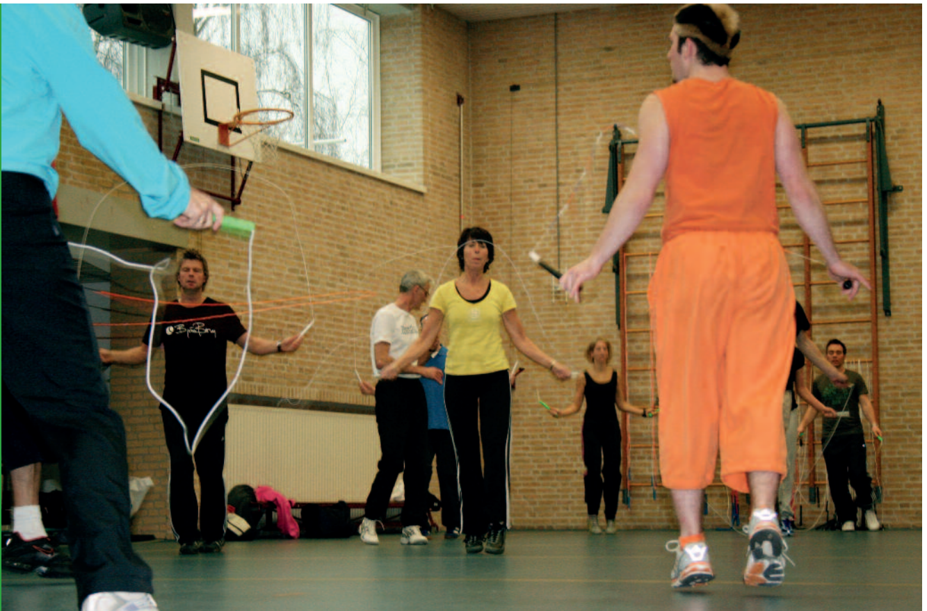
Touwtjespringen tijdens een workshop

Er zal via scholing en voorlichting veel aandacht uitgaan naar de implementatie en tevens de evaluatie en bijstelling van het in 2007 verschenen Basisdocument onderbouw VO. Het door KVLO en SLO ondersteunde netwerk onderbouw VO levert hiervoor een belangrijke input. De leerlijnen uit het Basisdocument worden aan de hand van filmbeelden op de website verduidelijkt.