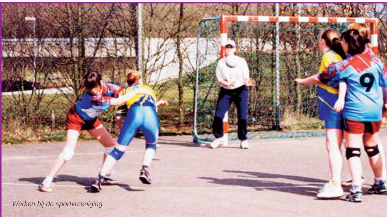
Werken bij de sportvereniging