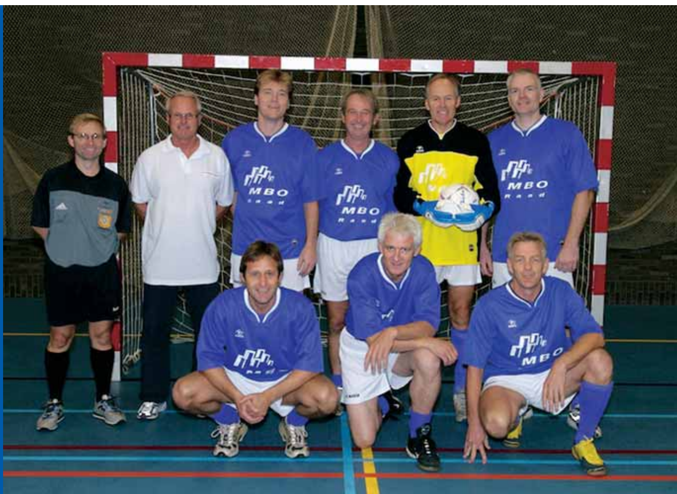
Het team van prominenten

* De lijst met namen wie er in het Nationaal team zitting hebben staat op onze site www.kvlo.nl