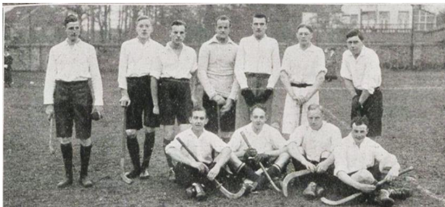
Afb. VII Op deze foto uit 1916 is te zien dat 'Arnhem' met een zwarte broek en een wit shirt speelt tijdens het Samovartoernooi in november in Nijmegen. Arnhem won dat toernooi door in de finale Nijmegen met 3-0 te verslaan.