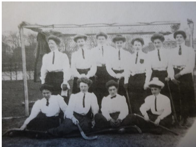
Afb.1 Het gecombineerde damesteam van Velp en Zutphen, dat in 1906 tegen Bloemendaal speelde.

tot nu toe. We moeten daarom aannemen dat de Velsche Hockeyclub al in dat jaar (1903) is ontstaan. 4 Pas in het eind van het jaar 1904 werd er weer gespeeld: op Eerste Kerstdag werd op het terrein van voetbalclub Vitesse op het sportcomplex Klarenbeek in Arnhem een demonstratiewedstrijd gespeeld om hockey te promoten tussen het Velpse team en een touringteam van spelers uit Haarlem en Den Haag. De westerlingen wonnen met 8-3. Helaas wordt nergens gemeld welke spelers er voor Velp uitkwamen. 5