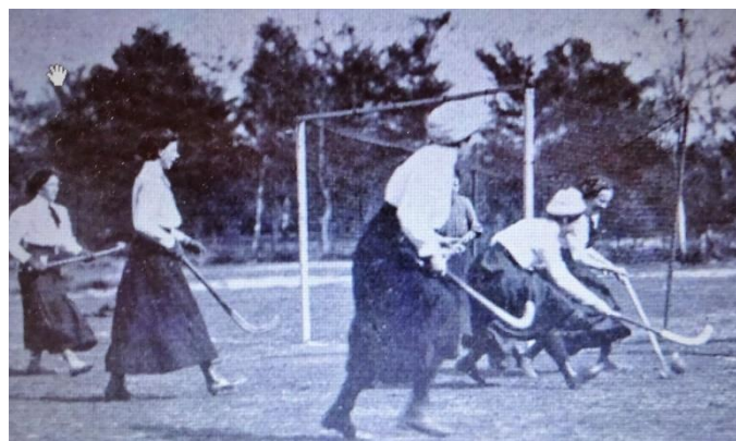
Afb. IV Spelmoment uit de dameswedstrijd Oost-West in mei 1912 op het veld van Velp. De grote bal ('sinaasappel') is goed te zien; let ook op de lange haken aan de sticks.

Ook werd meegedaan aan het mixedtoernooi dat de Zutphense Hockey Club sinds 1914 met de Kerstdagen (om de Van der Veldebeker) organiseerde. Velp verloor die eerste keer in de finale van Zutphen met 4-0. Ook met Kerstmis 1915 doet Velp daar nog aan mee. 27 Kortom, tussen 1909 en 1915 was de Velpse een club van belang.