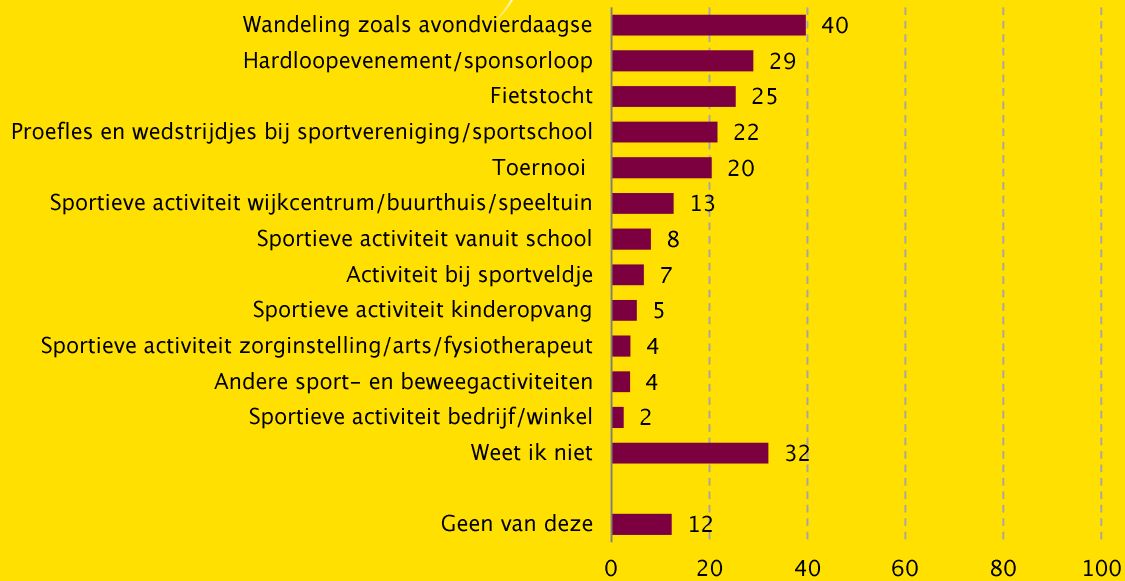
Figuur 1 Bekendheid van sport- en beweegactiviteiten in of vanuit de buurt in de afgelopen twaalf maanden, bevolking 16–80 jaar, meting 2016 (in procenten, n=1.578)