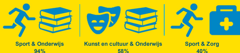
Figuur 2 Percentage gemeenten waarin buurtsportcoaches in genoemde sectorencombinatie actief zijn (top-3, in procenten)