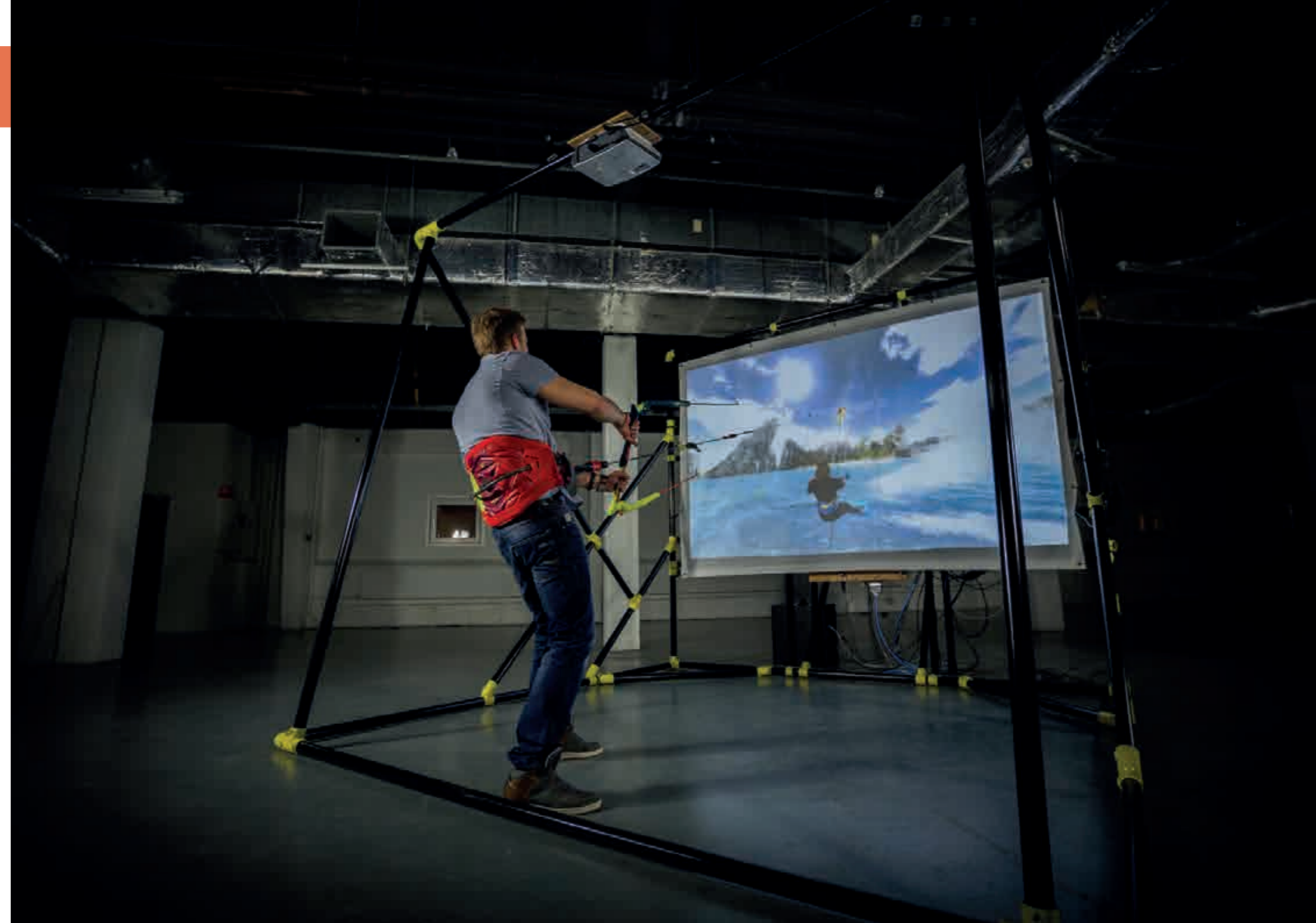
Kite Sim is de eerste realistische kitesurfsimulator