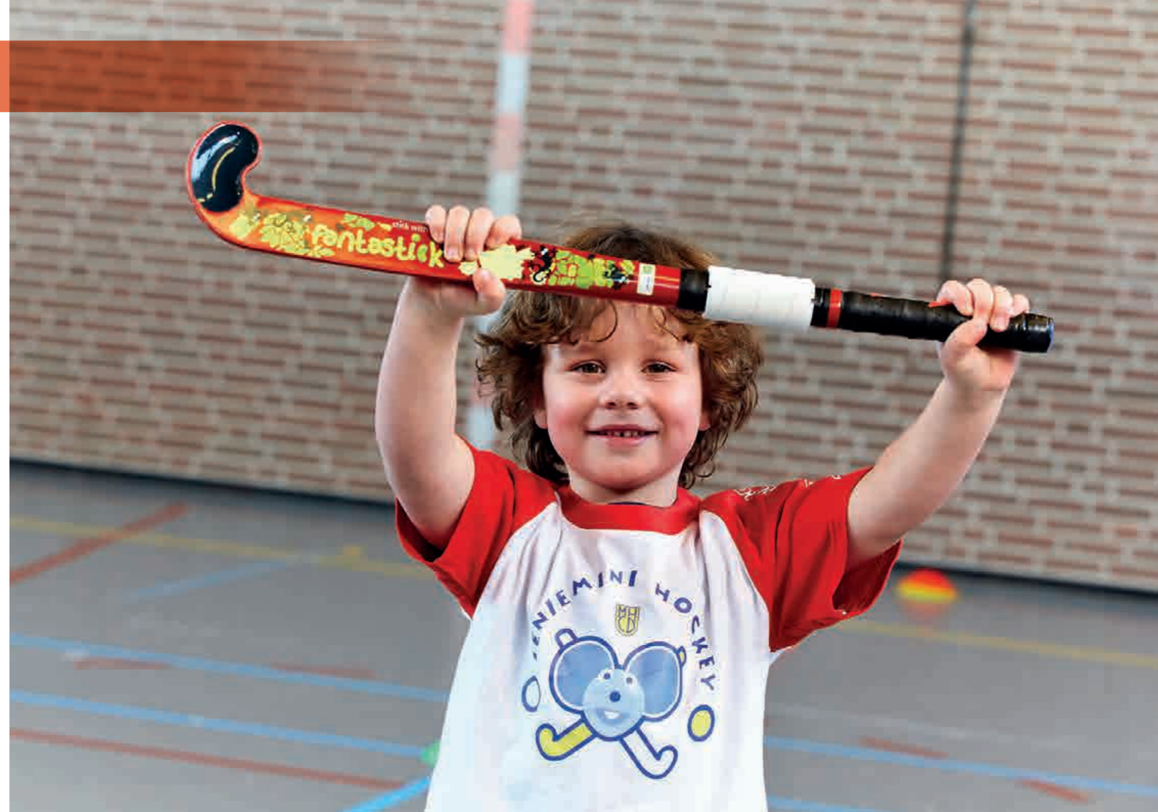
De Fantastick is een innovatieve junior hockeystick speciaal ontwikkeld voor kinderen tussen 3 en 7 jaar

Er wordt aan de sport, het bedrijfsleven, de overheden en de wetenschap gevraagd om deze ingediende voorstellen op hun merites (mee) te beoordelen. Er zal op basis van de input uit het netwerk en de gestelde criteria een transparante keuze worden gemaakt voor de beste voorstellen.