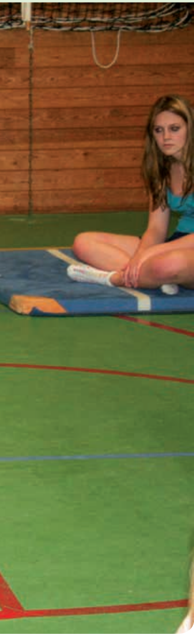
▲ Ruimte geven

Een voorbeeld uit de praktijk naar aanleiding van een training: we werden gevraagd om een training te verzorgen bij een voetbalklas. De klas draaide niet lekker, er werd veel op elkaar gescholden en spelers werden buitengesloten. Vanaf de start van de training werd al duidelijk dat de normdrager aan de kant zat en geen zin had om mee te doen aan de activiteit. Er was tussen een aantal voetballers die wel bezig waren voortdurend oogcontact met de kant. De normdrager had zijn uiterste best gedaan om ons te vermijden maar hield ons wel steeds in de gaten. De meelopers deden wel mee maar hun deelname kleurde zich als te lomp en te hard. De sfeer in de groep was grimmig en onplezierig, precies zoals ons was verteld door de school. Uiteindelijk kreeg de groep het redelijk voor elkaar om samen te spelen waarop wij een oprecht compliment gaven aan een belangrijke meeloper. Die wist zich geen raad met zoveel positieve aandacht van de formele leiders en raakte ter plekke in verwarring over wat nu te doen