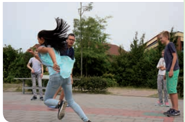
▲ Erg leuk als de leerkracht meespeelt!