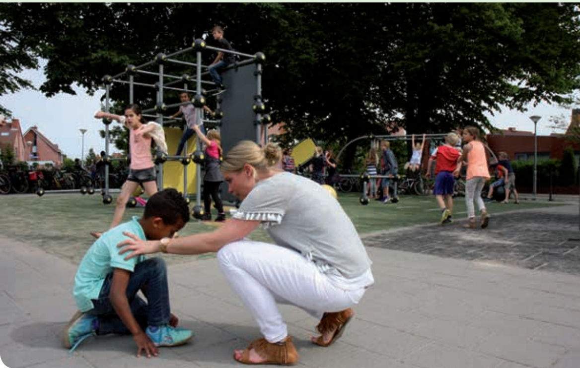
◀ Individuele aandacht is eenvoudiger als het buitenspelen goed geregeld is