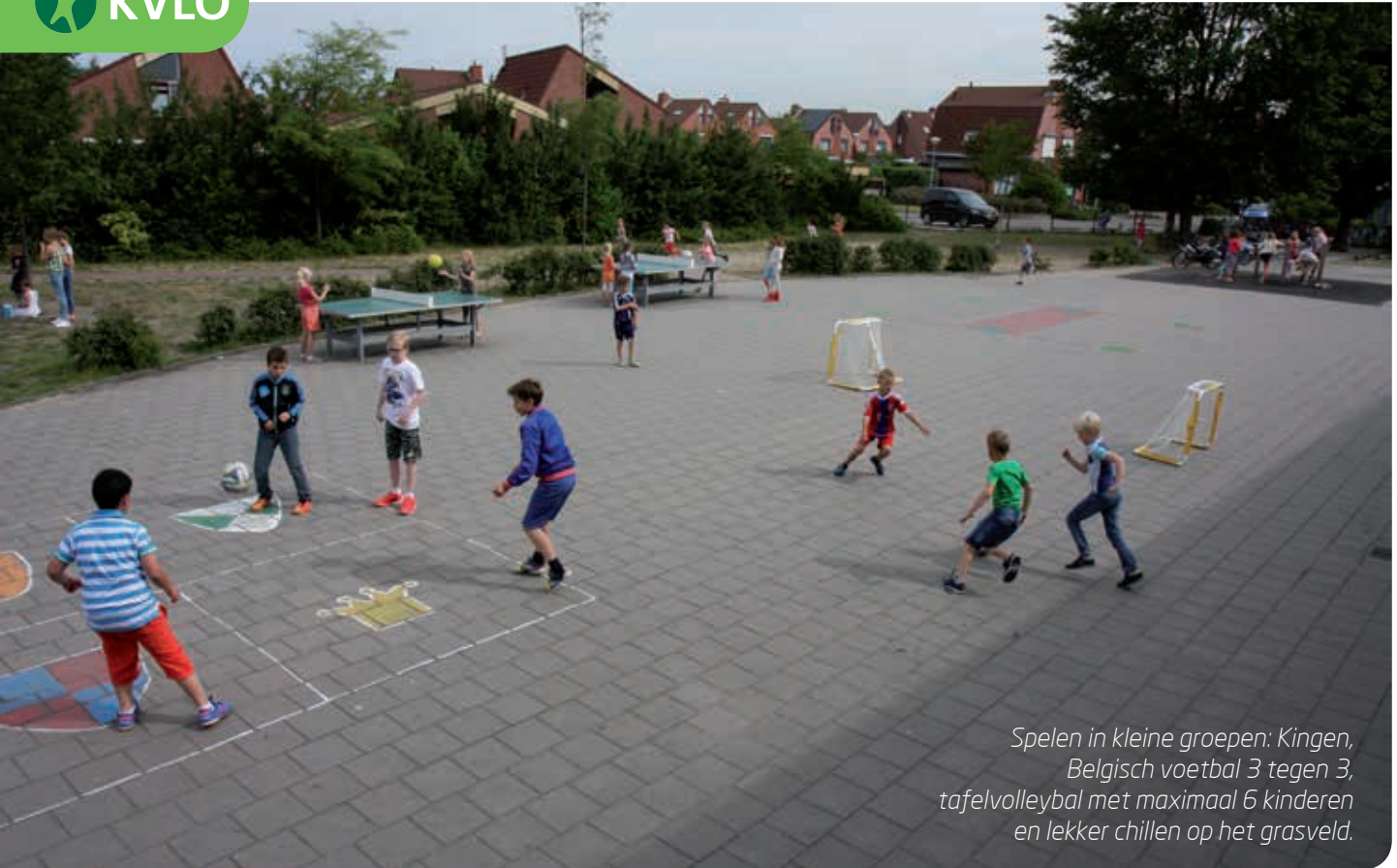
Spelen in kleine groepen: Kingen, Belgisch voetbal 3 tegen 3, tafelvolleybal met maximaal 6 kinderen en lekker chillen op het grasveld.