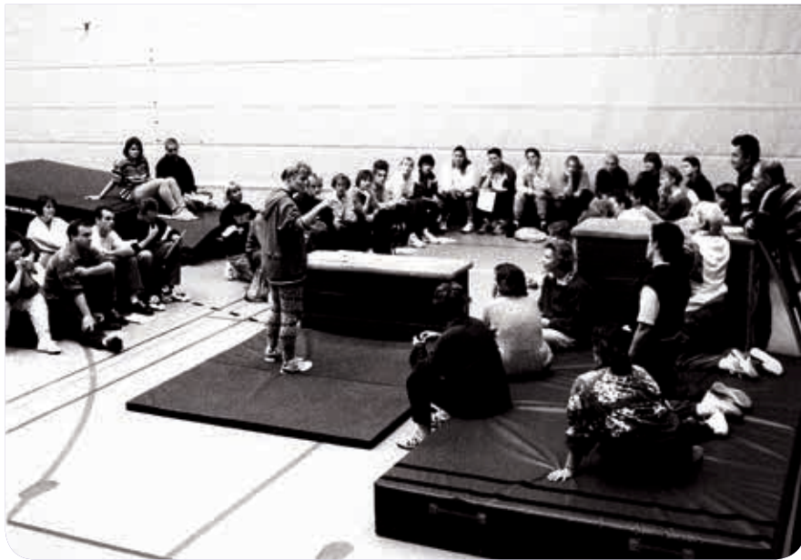
▲ Scholing in de jaren '80