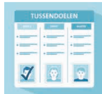
▲ Figuur 2. Tussendoelen