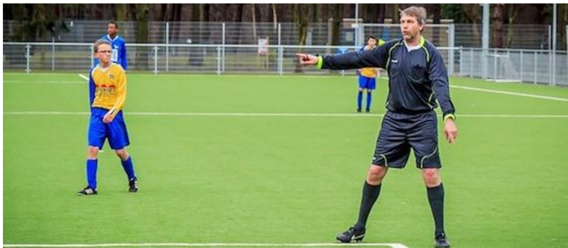
Scheidsrechters waarderen de sociale veiligheid met een 7,9.

23 november 2016 // Mulier Instituut // Door: David Romijn