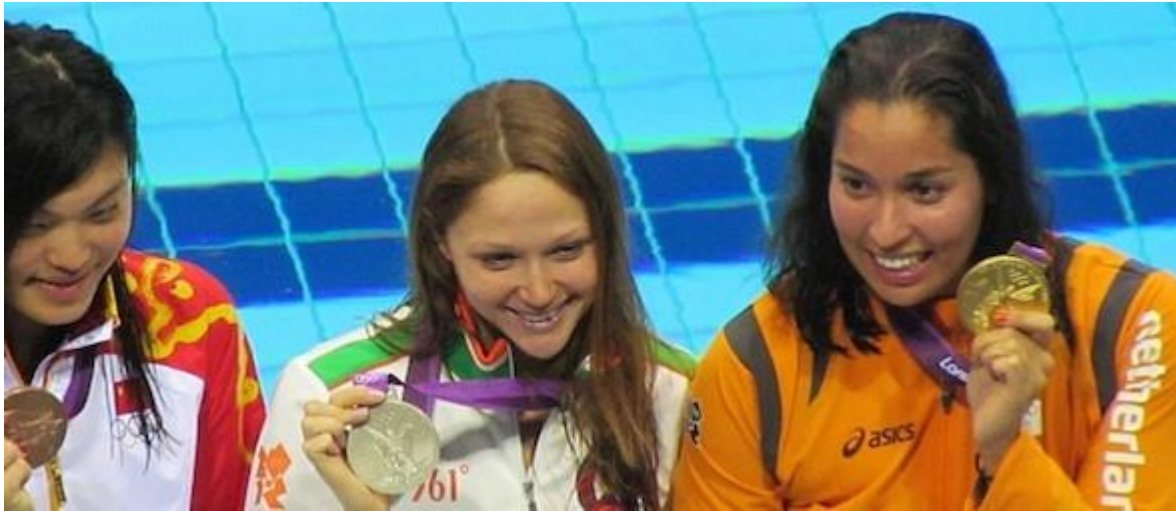
Ranomi Kromowijoko met haar gouden olympische medaille in London 2012.

4 augustus 2016 // Mulier Instituut // Door: David Romijn