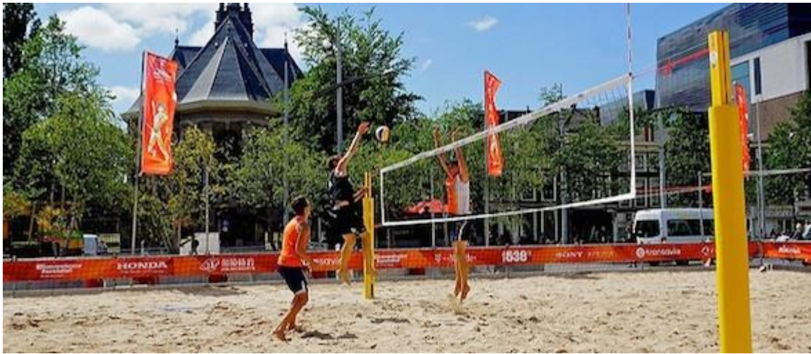
Nederland was vorig jaar organisator van het WK Beachvolleybal in o.a. Den Haag.

4 mei 2016 // Mulier Instituut // Door: David Romijn