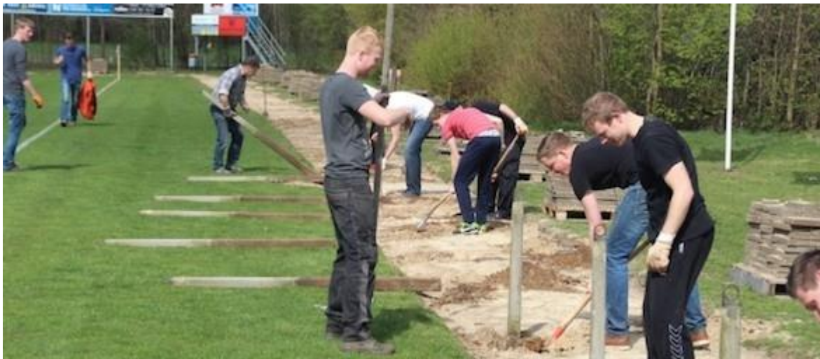
Vrijwilligers aan het werk bij Sportclub Markelo.

6 november 2015 // Mulier Instituut // Door: David Romijn