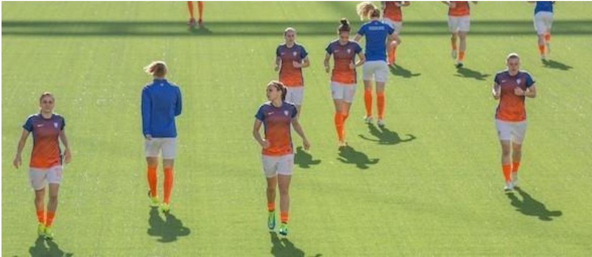
De Oranjeleeuwinen tijdens het WK voetbal in Canada.

4 augustus 2015 // Mulier Instituut // Door: David Romijn