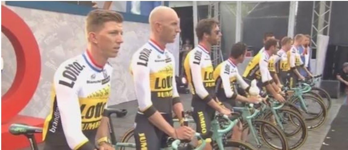
LottoNL-Jumbo is in de Tour de France dit jaar de enige Nederlandse ploeg.

3 juli 2015 // Mulier Instituut // Door: David Romijn