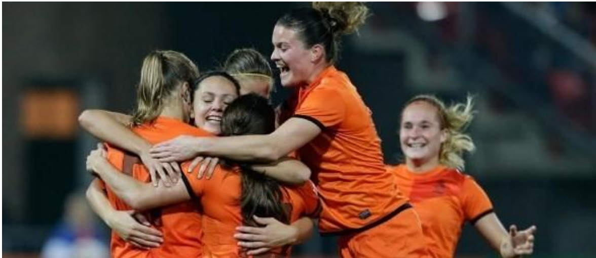
De Oranjevrouwen afgelopen woensdag tegen Estland

25 mei 2015 // Mulier Instituut // Door: David Romijn en Rens Peeters