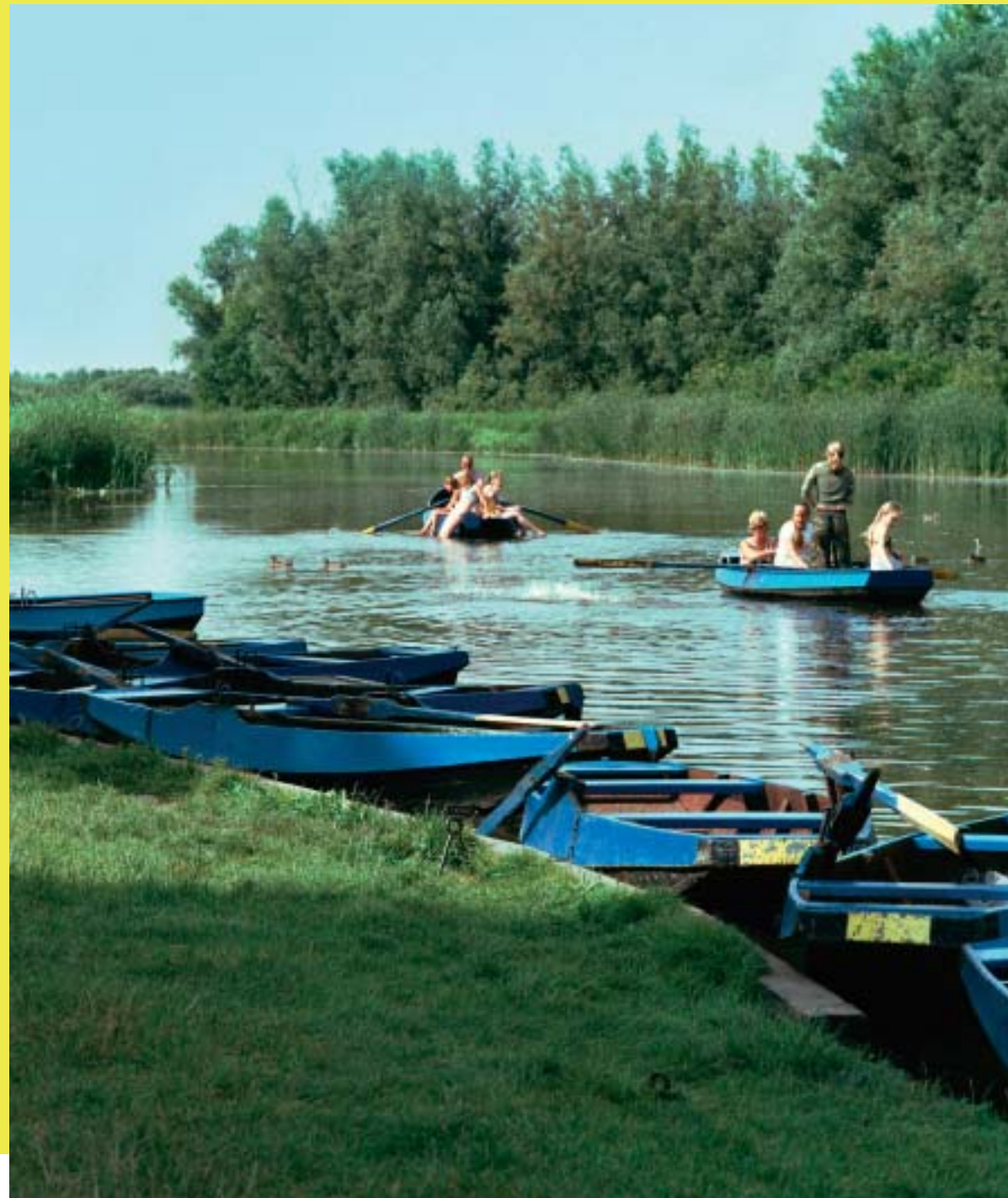
voor grote en kleine waterlopen en hun oevers moeten regionale beleidsvisies worden ontwikkeld waarmee de mogelijkheden voor onder meer zonnen, zwemmen, sportvissen, roeien, kanoën en toerschaatsen worden vergroot

uit: 'Pret' geschreven door Tracy Metz, 2002