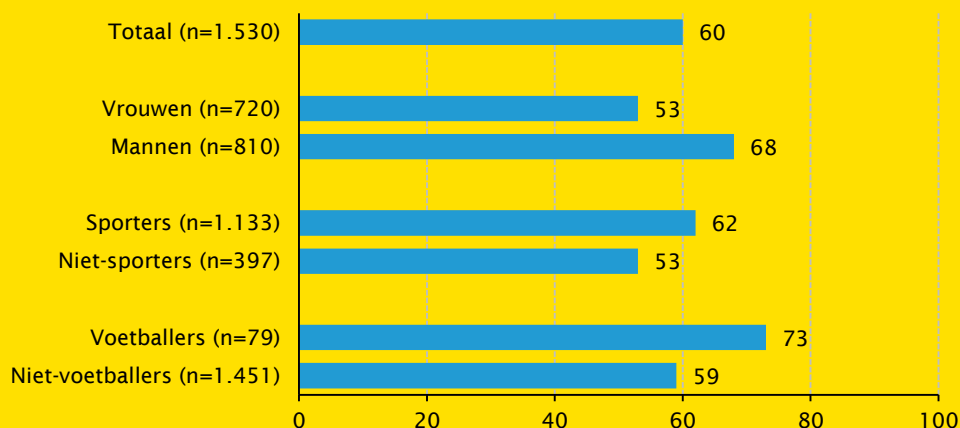
Figuur 1 Mate waarin EK vrouwenvoetbal 2017 is gevolgd (Nederlandse bevolking 16-80 jaar, in procenten)