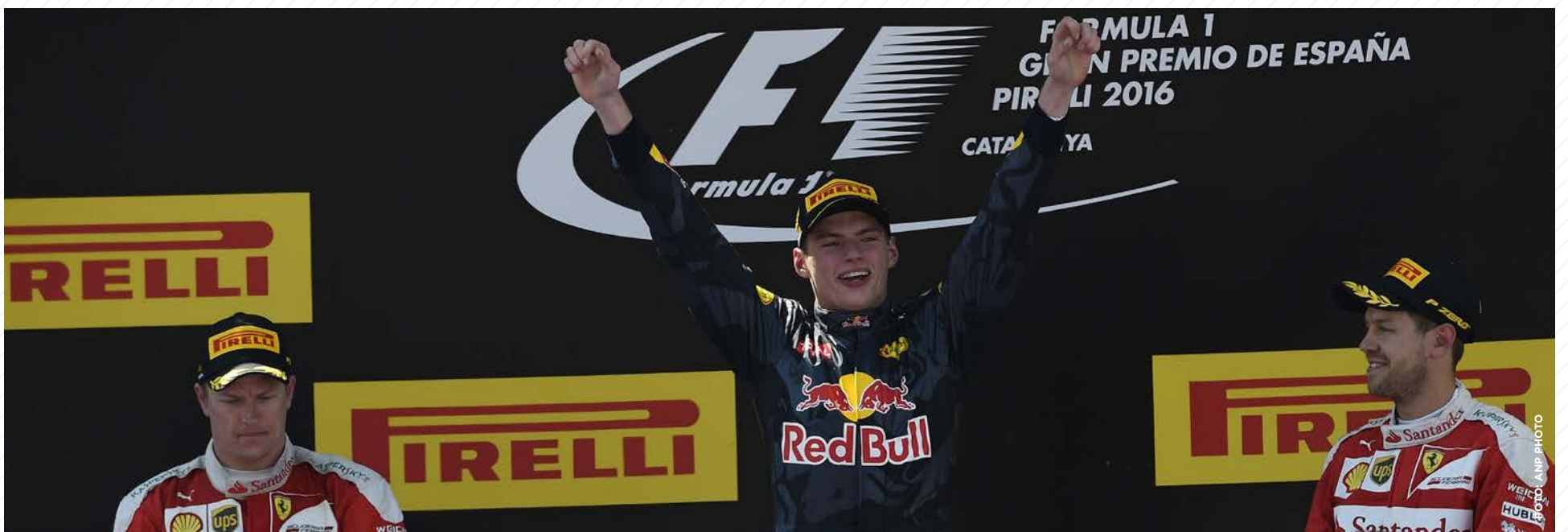
MAX VERSTAPPEN SCHREEF GESCHIEDENIS MET ZIJN ONVERGETELIJKE OVERWINNING IN BARCELONA.

Bijzondere prestaties in de sport zijn er met grote regelmaat, maar niet iedere bijzondere prestatie is uitzonderlijk. Uitzonderlijke prestaties zijn die sportprestaties waar mensen het jaren later nog over hebben. Prestaties die in het geheugen gegrift staan, die de liefhebbers decennia later nog kippenvol bezorgen en die vorm geven aan de levensgeschiedenis van de betrokken atleet en aan die van ons gewone stervelingen.