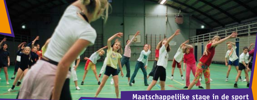
Maatschappelijke stage in de sport