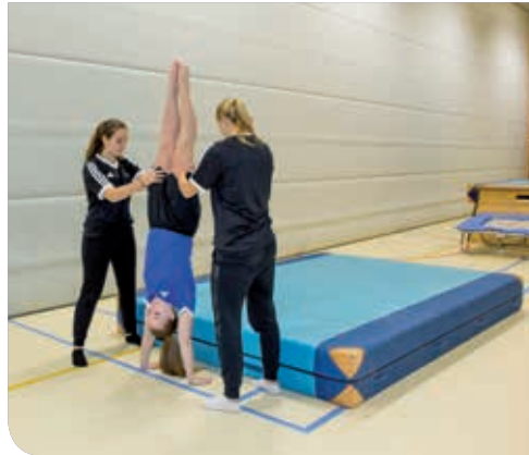
▲ Tabel 2: voorbeeldinstructies die een externe focus uitlokken bij het maken van een handstand (Nuij, 2016).

Met deze methode probeert de bewegingsonderwijzer de bewegingsuitvoering niet met verbale bewegingsaanwijzingen te beïnvloeden, maar met de inrichting van het bewegingsarrangement en/of de keuze van de opdracht. Een slimme keuze van het aantal aanvallers en verdedigers in combinatie met markeringen op de vloer waarbij de leerlingen alleen op de markeringen bal mogen passen of ontvangen, kan bijvoorbeeld een spelsituatie uitlokken waarin kinderen 'als vanzelf' afspeellijnen openen en sluiten. In het aanleren van de lay-up vanuit verschillende richtingen met het accent op de twee-pas zou je eraan kunnen denken om de passen te sturen met markeringen: Rood voor Rechts en geel voor Links. Zie Tabel 3 voor aanpassingen in de opdracht en het bewegingsarrangement die een gewenste bewegingsuitvoering kunnen uitlokken in het turnen.