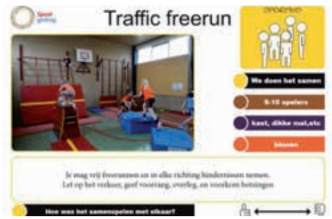
Leskaarten Traffic Freerun en Overview