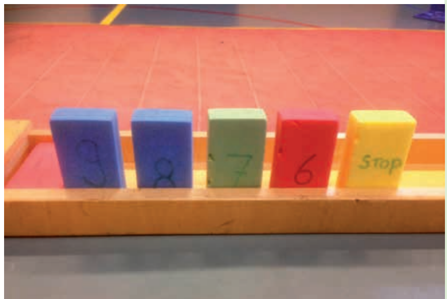
▼ Tellen met blokjes

hun differentiatie kunnen toepassen. Buiten de regels van het standaard spel kunnen de kinderen er zelf voor kiezen om het moeilijker te maken of juist makkelijker. Door een groen lintje te pakken mag je bijvoorbeeld gebruik maken van meerdere vrijplekken bij tikspelen, mag je bij lijnbal de bal vangen, mag je bij trefbal afwerpen met je handen of speel je met een klein doeltje bij doelspelen. Door een rood lintje te pakken ga je voor meer uitdaging. Bij tikspelen mag je geen gebruik meer maken van een vrijplek, bij lijnbal speel jij in één keer door, bij trefbal geldt een vangbal van jou